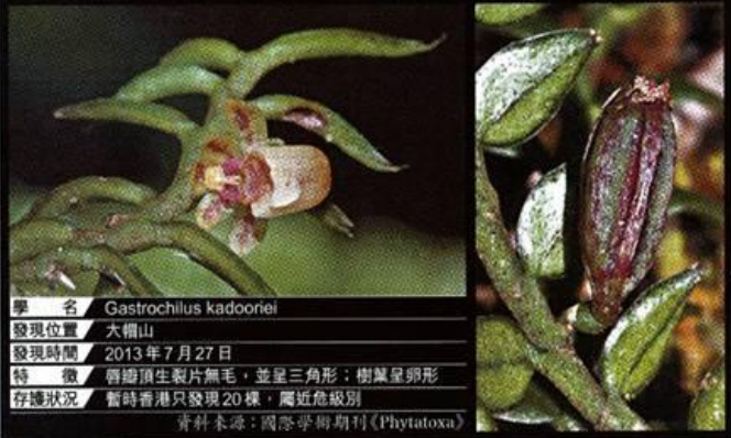
嘉道理盆距蘭小檔案

【記者蔡元貴報導】面對無止境的城市化威脅，本土原生蘭花依然能夠殺出重圍。嘉道理農場去年發現全新的蘭花品種，並於最近獲得國際專家確認。新種蘭花名為「嘉道理盆距蘭」(Gastrochilus kadooriei)，在大帽山只錄得20棵，被列為「近危」級別。